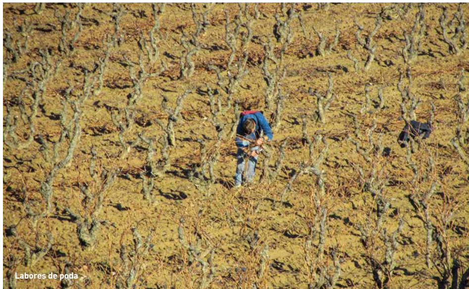
Labores de poda

La tierra pertenece emocionalmente a quien la cultiva. Es un vínculo romántico innegable y al mismo tiempo es el inicio de una bonita relación, que cuenta con la aprobación de las témporas y cabañuelas.