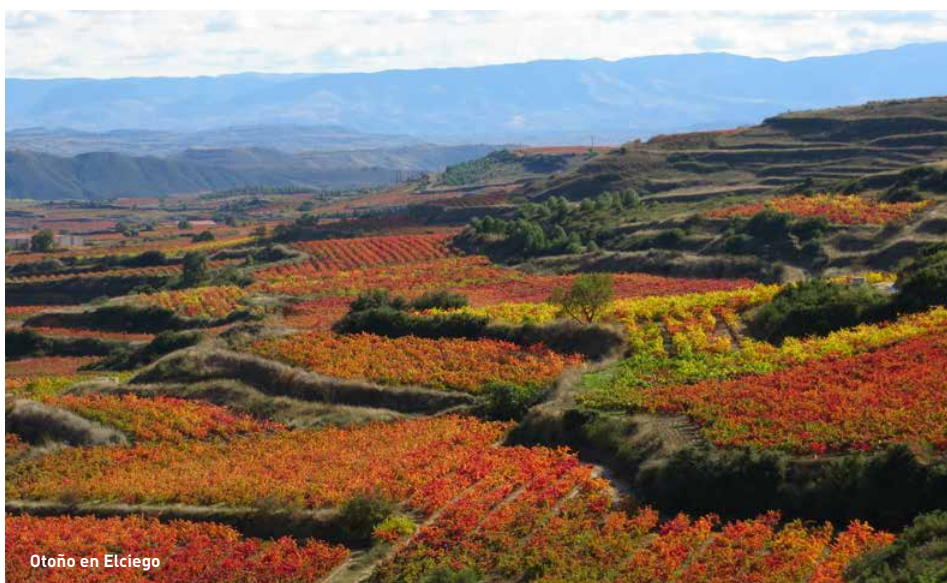
Otoño en Elciego

El río Ebro, con sus siete afluentes riojanos (Tirón, Oja, Najerilla, Iregua, Leza, Cidacos y Alhama), es el eje longitudinal de la denominación de origen. Las montañas, el Toloño y la sierra de Cantabria al norte y la sierra de la Demanda al sur, determinan el característico paisaje de Rioja y generan un hábitat privilegiado para la viña y la producción de vinos de calidad.