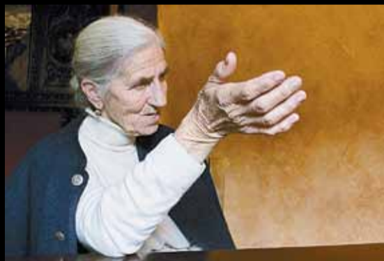
LINES VEJO CALOCA (CANTABRIA)

«¿Fracasar? El único fracaso es morir, que ya no haces más»