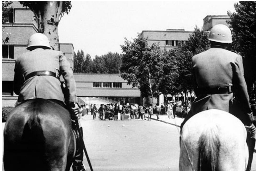
Los «grises» ante una manifestación estudiantil en la Complutense. 1968.

Esos aires de renovación que parecen llegar a ciertos sectores eclesiásticos, van a tener un importante representante también en EEUU, donde un monje de la Orden Cisterciense, Thomas Merton , va a desplegar una prédica profundamente antibelicista y antinuclear, apoyando públicamente la huelga general por la paz, llamando a boicotear la industria armamentística, porque según sostiene, el silencio es complicidad con las fuerzas que llevan a cabo la opresión, la injusticia, la explotación y la guerra.