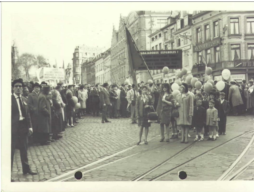
Manifestación por los detenidos en España, 7 de octubre de 1962. Bruselas.

La huelga va a coincidir con la solicitud realizada por el Régimen para ingresar en la Comunidad Económica Europea (CEE), lo que hará que la prensa europea multiplique la presencia de corresponsales. Una situación muy comprometida para el Régimen, que declarará el estado de excepción en Asturias, Vizcaya y Guipúzcoa, suspendiendo por tres meses el ejercicio de los derechos recogidos formalmente en el Fuero de los Españoles. Cerca de 400 trabajadores serán detenidos, proliferarán las palizas y torturas en comisaría. Más de un centenar de huelguistas serán deportados a provincias alejadas de las zonas de conflicto.