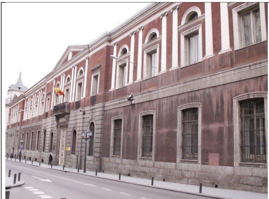
Sede de la Universidad de Madrid en 1956 en la calle de San Bernardo.

En ese momento, un joven Rodolfo Martín Villa, con tan solo 28 años, pero jefe nacional del SEU, diagnosticará en un informe «que la juventud se nos ha ido» porque no la hemos dejado disenter ni siquiera en lo circunstancial o puramente formal... Y según su balance se debe a que se les ha prometido la revolución de José Antonio y la revolución sigue estando pendiente en una sociedad aburguesada. El discurso nacionalsindicalista próximo al fascismo/nazismo parecería estar teñido de «izquierdismo formal» si no fuera porque sirve para amparar que se siga torturando a los detenidos antes de ser enviados a la cárcel por los tribunales militares, al equiparar la protesta estudiantil con la rebelión militar.